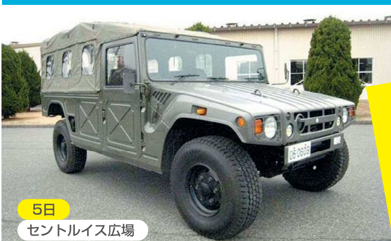
5日 セントルイス広場

主催：国営木曾三川公園 三派川地区センターイベント実行委員会 後援：木曾川上流域公園整備促進期成同盟会